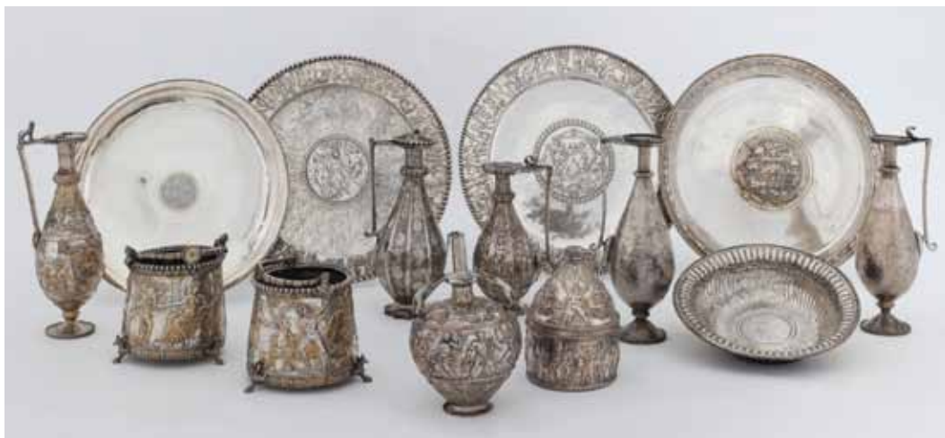
A Seuso-kincs tizennégy ismert ezüstedénye

A Seuso-kincs egy 14 darabból álló kincslelet. Ezüstedényeit evéshez, iváshoz és tisztálkodáshoz használták. A kincs majdnem 50 éve a föld alól került elő egy rézüstben, és megtalálása óta nagyon kalandos utat járt be. Nevét a tulajdonosáról, Seusóról kapta, aki a Balaton vidékén élő római előkelő volt.